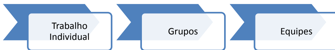
Figura 2 - Evolução do trabalho coletivo. Adaptado de: (Rennó, 2013)

Assim, as equipes de trabalho geram sinergia positiva através de uma coordenação de seu trabalho, ou seja, o somatório de seu resultado é maior do que seria o somatório dos resultados isolados de seus membros 11 .