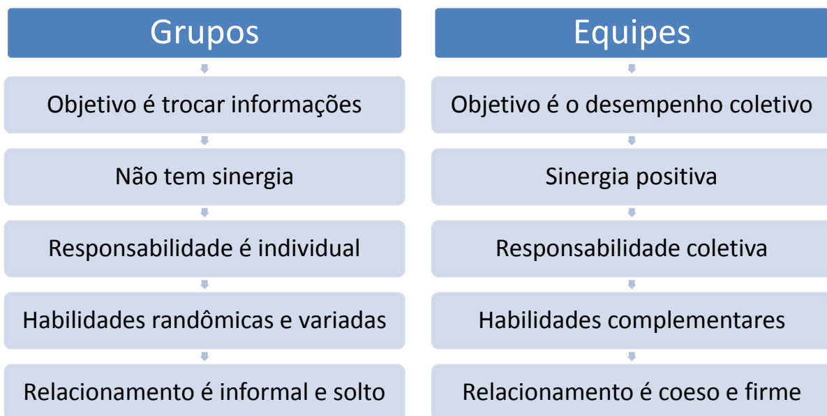
Figura 3 - Diferença entre grupos e equipes - Fonte: (Chiavenato, Administração nos novos tempos 2010)

De acordo com Chiavenato, as principais diferenças entre um grupo e uma equipe de trabalho são 13 :