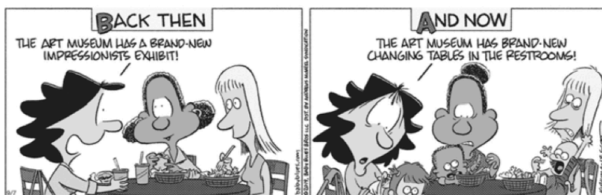
Baby Blues by Rick Kirkman and Jerry Scott

(Disponível em: https://www.gocomics.com )