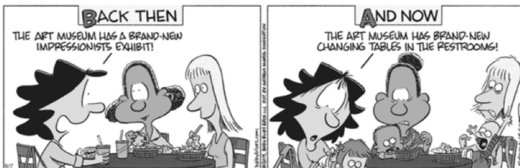
Baby Blues by Rick Kirkman and Jerry Scott

(Disponível em: https://www.gocomics.com )