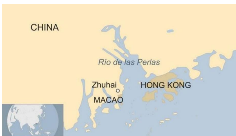
Localização de Hong Kong. Elaboração: G1.

Macau, ex-colônia de Portugal, também detém o status de Região Administrativa Especial da China.