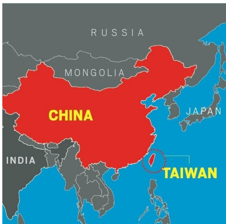
Localização da ilha de Taiwan

Outro foco de divergência é sobre a questão da ilha de Taiwan , que a China considera uma província rebelde e quer reintegrar ao país.