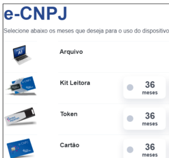
Figura 2 – Venda de certificados digitais

9. (FUNDATEC / ISS-Porto Alegre - 2022) Um certificado digital "e-CNPJ", do tipo "A1", após devidamente emitido, pode ser armazenado: