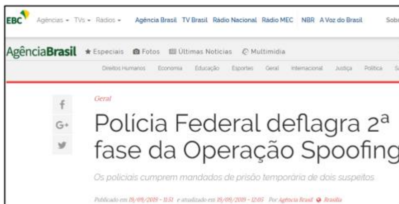
Figura 1 – Notícia da Agência Brasil

8. (FUNDATEC / ISS-Porto Alegre - 2022) A Figura 1 apresenta notícia a respeito da 2ª fase da Operação Spoofing, na qual os policiais federais cumpriram dois mandados de prisão temporária e outros de busca e apreensão em endereços de pessoas ligadas à organização criminosa investigada. Os criminosos invadiram os celulares de autoridades, tendo acessado e tomado conhecimento de informações, muito delas sensíveis, sem autorização dos respectivos proprietários. Nesse caso, é correto afirmar que o seguinte princípio básico da Segurança da Informação foi violado: