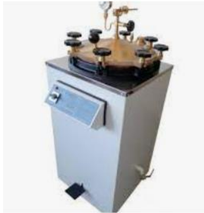
Figura 5: Uma autoclave.