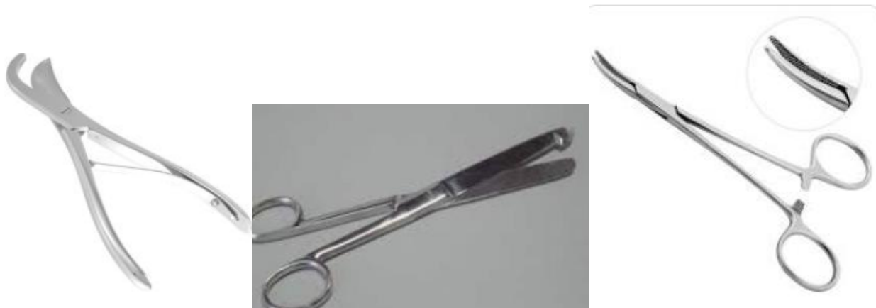
Figura 13: da esquerda para a direita: Costótomos, enterótomos e pinça hemostática.