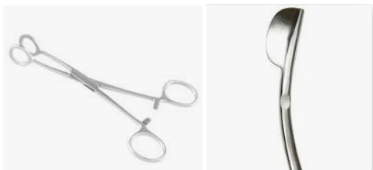
Figura 14: da esquerda para a direita: pinça de Collin, raquitômetro.