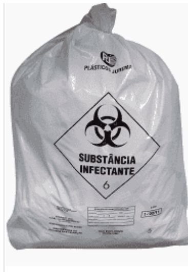
Figura 6: saco plástico classe II.

Materiais perfuro cortantes como seringas, agulhas e bisturis devem ser descartados no interior de embalagens apropriadas, que são dotadas de paredes rígidas e resistentes a autoclavagem . Esses recipientes devem se encontrar próximos dos locais de uso dos instrumentos, evitando-se a movimentação no ambiente com materiais infectados, o que pode elevar o risco de acidentes. Para o descarte, não se deve entortar, recapar ou quebrar agulhas, as quais devem ser mantidas junto com as seringas.