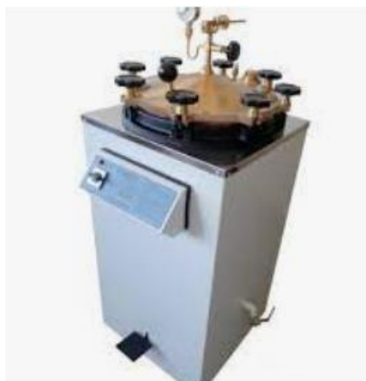
Figura 5: Uma autoclave.