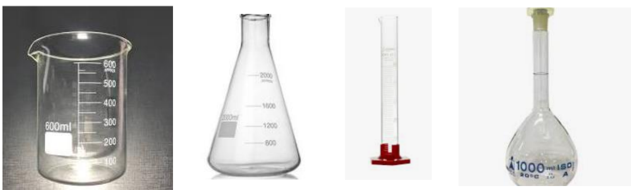
Figura 7: Da esquerda para a direita: Becker, Erlenmeyer, proveta e balão volumétrico.