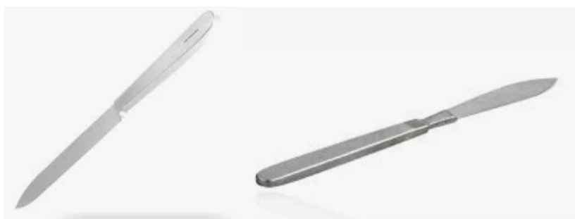
Figura 9: à esquerda uma faca de Collin. À direita uma faca de Vichow.