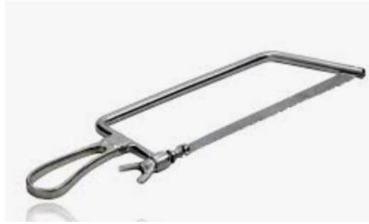
Figura 12: Serra de Mathieu.