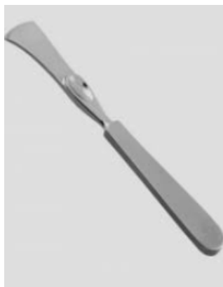
Figura 11: uma rugina.