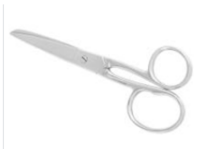
Figura 10: uma tesoura de Smith.