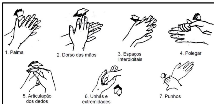
Figura 4: procedimento correto de lavagem das mãos.

Um dos procedimentos mais básicos e eficientes dentre as ações de prevenção em biossegurança é a lavagem correta das mãos . A figura abaixo mostra como isso deve ser realizado de forma adequada.