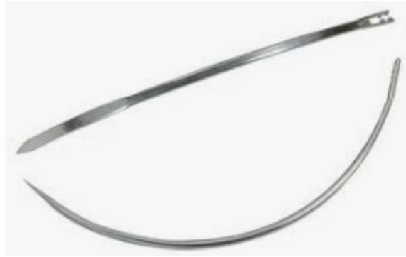
Figura 15: agulhas de sutura.