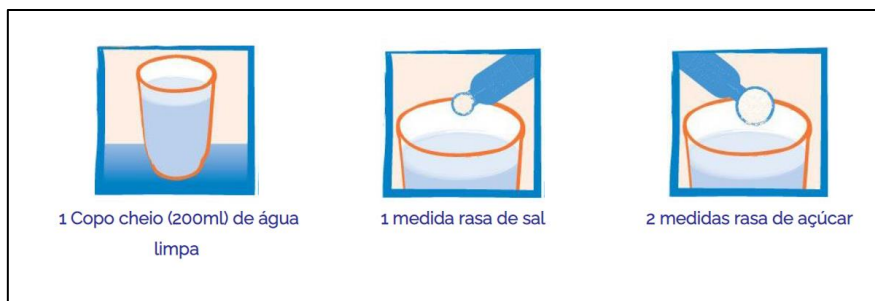
Figura 1: exemplo de solução - soro caseiro.

muito grande, nossa solução ficará pouco concentrada, o que também não é adequado. Note, no entanto, que a quantidade de matéria de sal e açúcar não mudou nas situações hipotéticas.