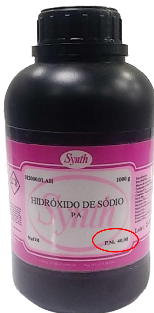
Figura 3: a embalagem de NaOH da marca Synth. Em destaque indicação do peso molecular que devemos utilizar para calcular massa para preparo de solução.

Precisaremos inicialmente descobrir qual a massa de NaOH que deveremos adicionar em nossa solução para conseguir obter tal concentração. Recordando os conceitos de Avogadro que estudamos acima, veremos que a quantidade de 1mol pode ser obtida a partir da massa molecular do NaOH . Em outras palavras, sabendo a massa molecular do NaOH, saberemos quantas gramas de hidróxido de sódio puro temos que ter para conseguirmos 1mol de moléculas. Isso será importante pois a concentração de 1molar representa 1 mol de NaOH por litro de solução. Assim, se dissolvermos a massa de substância que apresenta 1mol de NaOH em 1litro de solvente, obteremos uma solução de concentração 1M. Para descobrirmos o quanto de NaOH deveremos misturar em 1L de solvente, podemos consultar sua massa molecular na embalagem que acondiciona o produto, conforme verificamos na figura abaixo, ou podemos calcular essa massa procurando as massas atômicas dos átomos que formam o hidróxido de sódio: Na = 23u, O = 16u e H=1u, total de 40u.