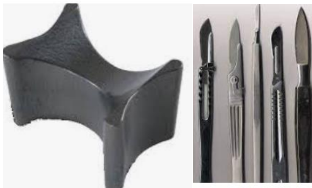
Figura 8: Cepo e bisturis.