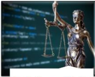
Direito de acesso à Justiça