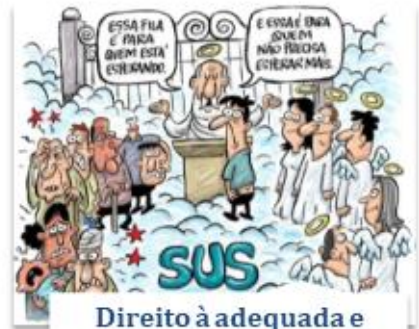
Direito à adequada e eficaz prestação dos serviços públicos