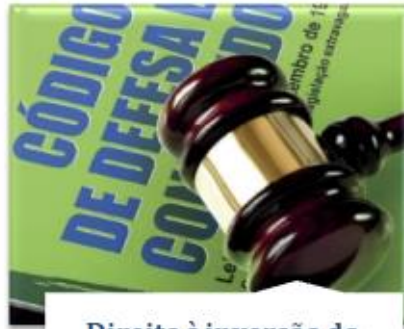
Direito à inversão do ônus da prova