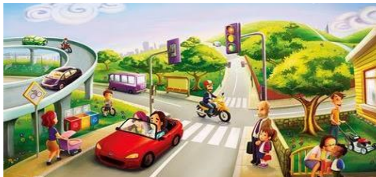
(Fig. 1 – trânsito pessoas e veículos)

“Art. 1º (...) § 1º Considera-se trânsito a utilização das vias por pessoas, veículos e animais, isolados ou em grupos, conduzidos ou não, para fins de circulação, parada, estacionamento e operação de carga ou descarga.”