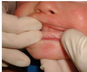
Figura 23- Estimulação digital do palato anterior em um bebê com Síndrome de Down.