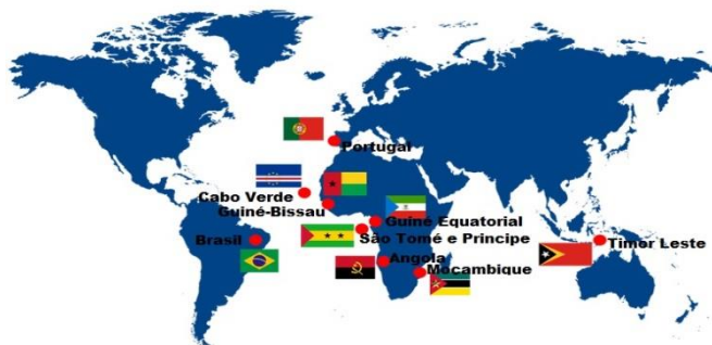
Figura 1 - O mundo da lusofonia

O Acordo tem como objetivo unificar as regras do português escrito em todos os países que têm a língua portuguesa como idioma oficial. A tentativa de termos essa unidade de grafia é uma prova que exemplifica a consciência da comunidade lusófona no intuito de estreitar suas relações econômicas, sociais, culturais, geográficas, políticas.