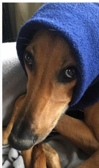
Moça com o Brinco de Pérola, de Johannes Vermeer