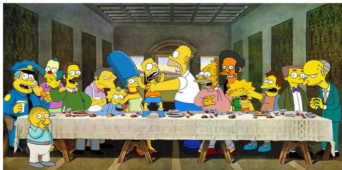
A Última Ceia de Leonardo Da Vinci