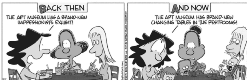
Baby Blues by Rick Kirkman and Jerry Scott

(Disponível em: https://www.gocomics.com )