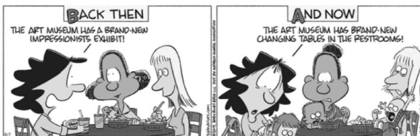
Baby Blues by Rick Kirkman and Jerry Scott

(Disponível em: https://www.gocomics.com )