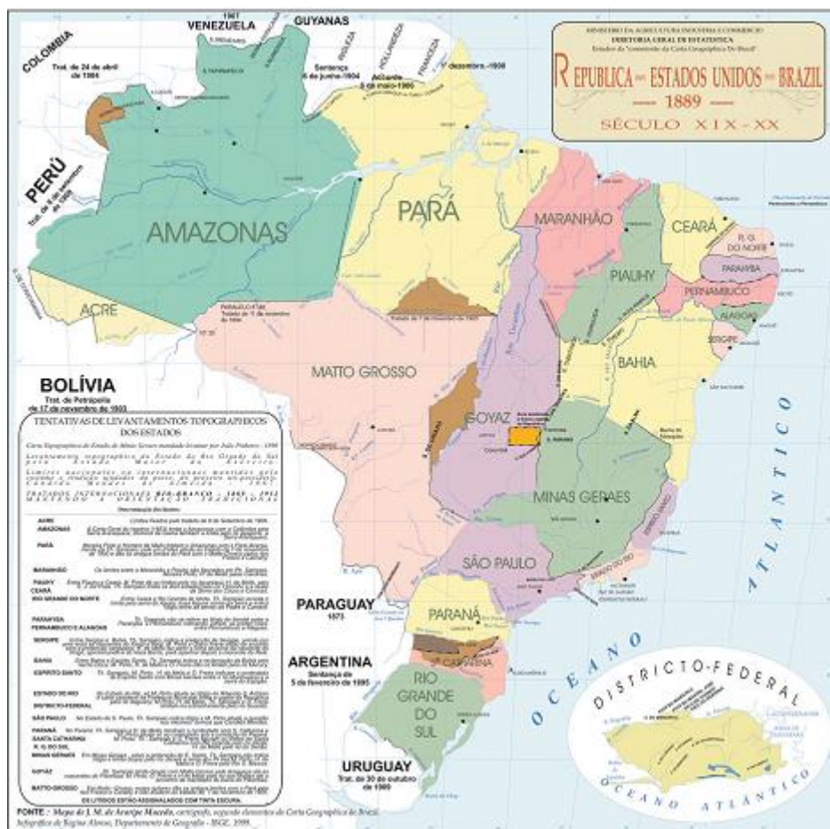
Mapa do Brasil do início da República, com a demarcação da área destinada à futura capital

Sendo Presidente da República o Exmo. Sr. Dr. Epitácio da Silva Pessoa, em cumprimento ao disposto no decreto 4494 de 18 de janeiro de 1922, foi aqui colocada em 7 de setembro de 1922, ao meio-dia, a Pedra Fundamental da Futura Capital Federal dos Estados Unidos do Brasil. (Pedra fundamental de Brasília)