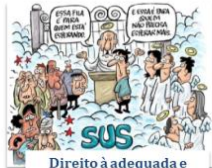
Direito à adequada e eficaz prestação dos serviços públicos