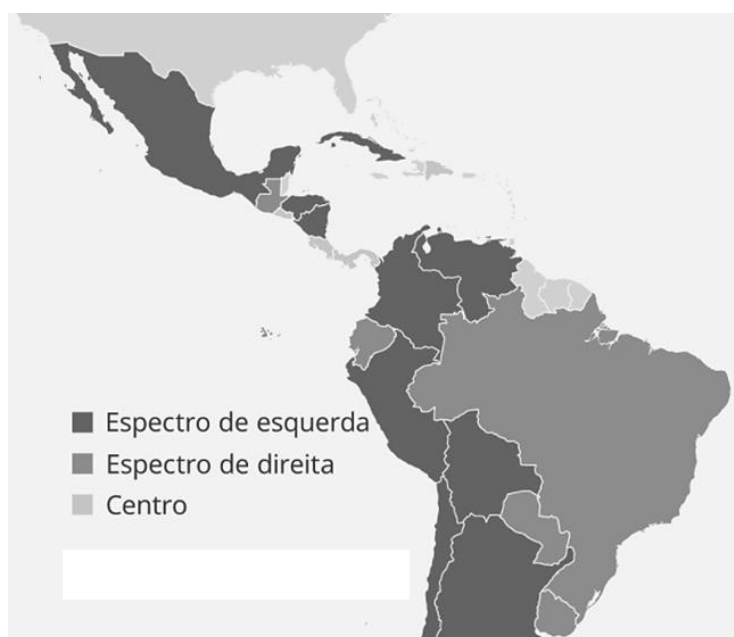
Mapa Político da América Latina

(Fonte: AFP | Dados de 20 de junho de 2022.)