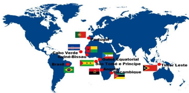
Figura 1 - O mundo da lusofonia

Futuros servidores , a vigência obrigatória do novo Acordo Ortográfico da Língua Portuguesa passou a valer a partir do dia 1º de janeiro de 2016 . Sua implementação estava prevista para 2013, mas o governo brasileiro adiou a medida para alinhar o cronograma com o de outros países lusófonos 1 e dar prazo maior para a adaptação da população.