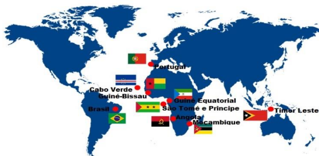
Figura 1 - O mundo da lusofonia

Futuros servidores , a vigência obrigatória do novo Acordo Ortográfico da Língua Portuguesa passou a valer a partir do dia 1º de janeiro de 2016 . Sua implementação estava prevista para 2013, mas o governo brasileiro adiou a medida para alinhar o cronograma com o de outros países lusófonos 1 e dar prazo maior para a adaptação da população.