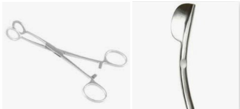
Figura 14: da esquerda para a direita: pinça de Collin, raquitômetro.