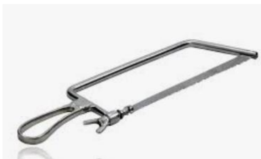
Figura 12: Serra de Mathieu.