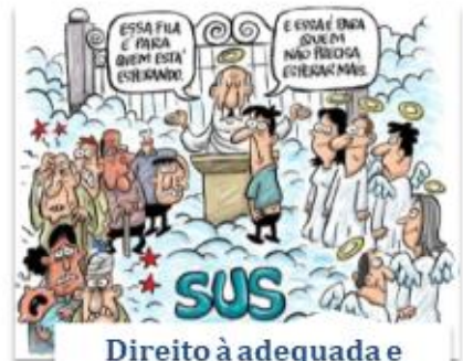
Direito à adequada e eficaz prestação dos serviços públicos