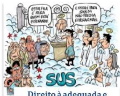
Direito à adequada e eficaz prestação dos serviços públicos