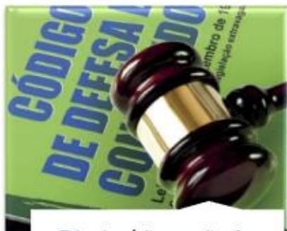
Direito à inversão do ônus da prova