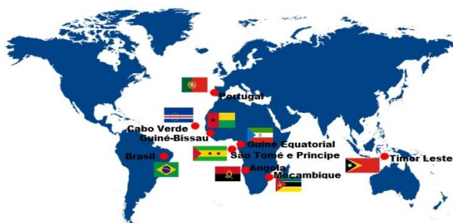
Figura 1 - O mundo da lusofonia

Futuros servidores , a vigência obrigatória do novo Acordo Ortográfico da Língua Portuguesa passou a valer a partir do dia 1º de janeiro de 2016 . Sua implementação estava prevista para 2013, mas o governo brasileiro adiou a medida para alinhar o cronograma com o de outros países lusófonos 1 e dar prazo maior para a adaptação da população.