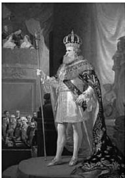
Pedro Américo, 1873 galeria.cluny.com.br