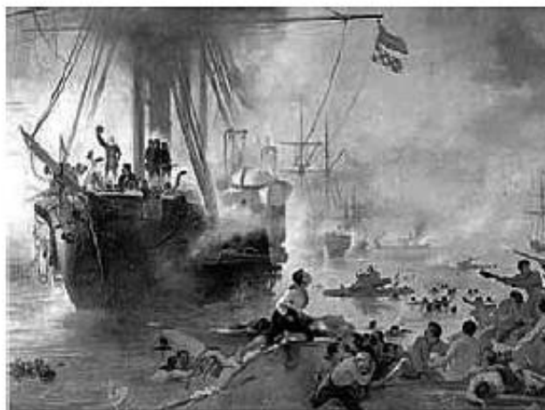
Victor Meirelles, 1872