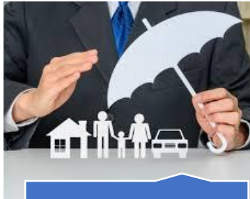
Direito à segurança