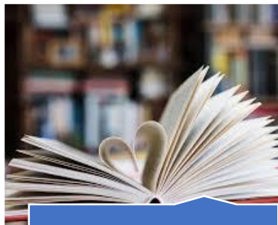
Direitos de autor