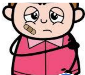
Proteção à integridade física e disposição do próprio corpo