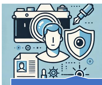
O direito à imagem e à voz