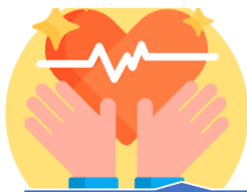
Direito à vida

Os direitos de personalidade foram codificados por forte influência da Declaração pela Organização das Nações Unidas de 1948, que inspirou os países a incorporarem esses direitos humanos em suas constituições e outros códigos, como ocorreu no Brasil com o Código Civil. São eles: