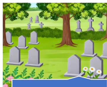
Proteção da personalidade depois da morte