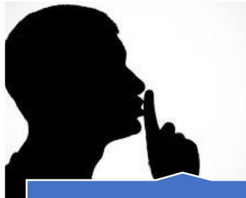
Direito ao sigilo