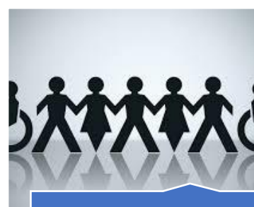
Direito à igualdade