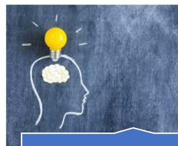
O direito à liberdade