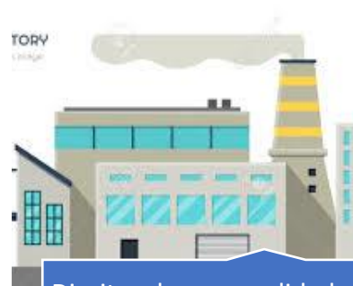
Direitos da personalidade da pessoa jurídica

Dessa forma, a intransmissibilidade e a irrenunciabilidade visam evitar que o próprio indivíduo ou terceiros coloquem em risco sua dignidade e seus direitos fundamentais, mesmo que voluntariamente.