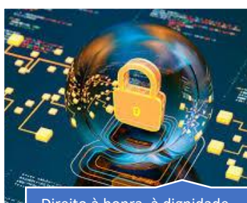
Direito à honra, à dignidade, ao respeito, à privacidade e à intimidade