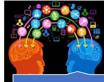
Direito à informação