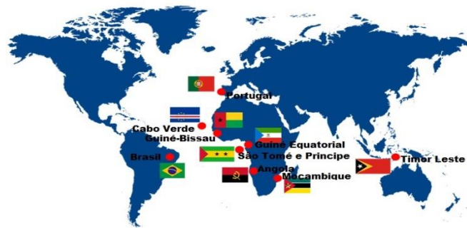
Figura 1 - O mundo da lusofonia

O Acordo tem como objetivo unificar as regras do português escrito em todos os países que têm a língua portuguesa como idioma oficial. A tentativa de termos essa unidade de grafia é uma prova que exemplifica a consciência da comunidade lusófona no intuito de estreitar suas relações econômicas, sociais, culturais, geográficas, políticas.