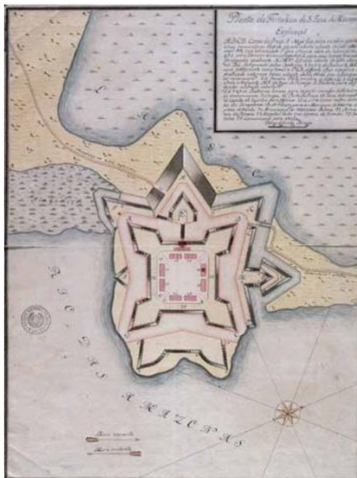
Planta da Fortificação de São José de Macapá, de Henrique A. Galluzzi.