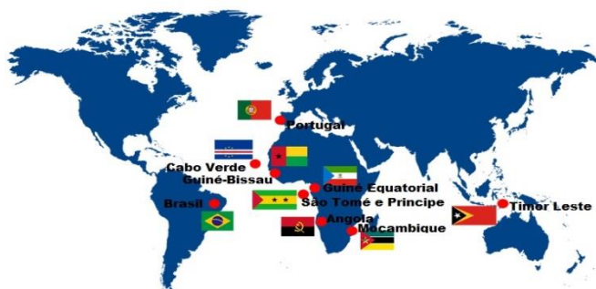
Figura 1 - O mundo da lusofonia

Futuros servidores , a vigência obrigatória do novo Acordo Ortográfico da Língua Portuguesa passou a valer a partir do dia 1º de janeiro de 2016 . Sua implementação estava prevista para 2013, mas o governo brasileiro adiou a medida para alinhar o cronograma com o de outros países lusófonos 1 e dar prazo maior para a adaptação da população.