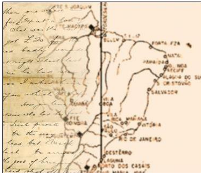
O território do Amapá estava totalmente em terras espanholas, pelo tratado de Tordesilhas.