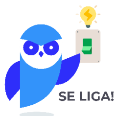
Figura 11- Malamed, 2021.

Você já deve ter ouvido falar sobre o EMLA , não?