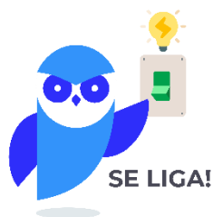
Figura 11- Malamed, 2021.

Você já deve ter ouvido falar sobre o EMLA , não?