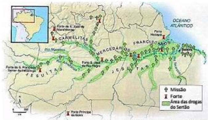
Mapa da ocupação da Amazônia entre os séculos XVI e XVIII.

A respeito dos objetivos da conquista político-religiosa do vale do Amazonas, no período colonial, pelos portugueses, assinale V para a afirmativa verdadeira e F para a falsa.