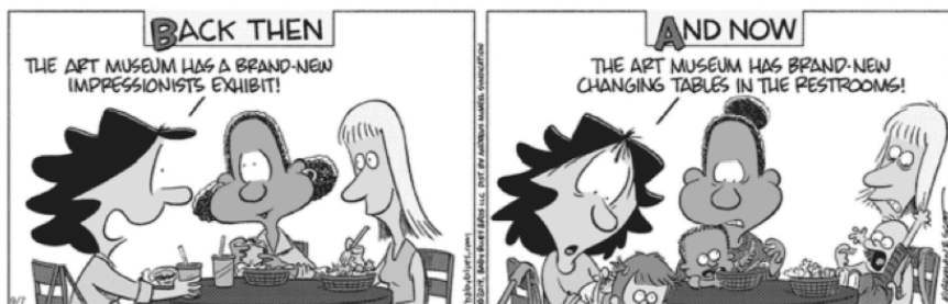
Baby Blues by Rick Kirkman and Jerry Scott